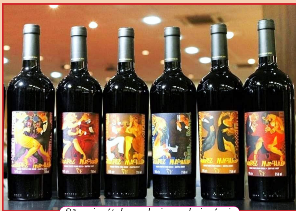
São seis rótulos exclusivos colecionáveis

blend produzido com uvas francesas Cabernet Sauvignon, Cabernet Franc, Malbec e Merlot, safra 2022, pela vinícola pioneira de altitude Villa Francioni .